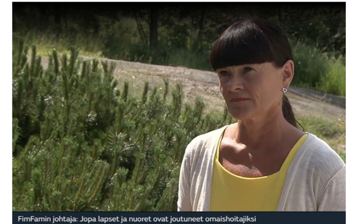
FinFamin johtaja: Jopa lapset ja nuoret ovat joutuneet omaishoitajiksi

Erinomaisen medianäkyvyyden ansiosta järjestö onnistui lisäämään tietoa mielenterveysomaisten arkeen liittyvistä ajankohtaisista teemoista ja koko järjestökentän tarjoamasta tuesta.